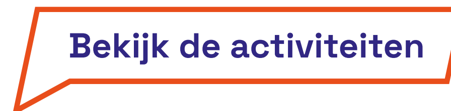
Spraakbubbel als button